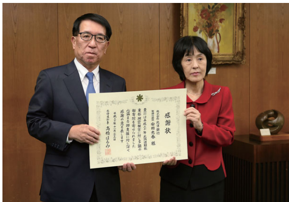
北海道庁での感謝状贈呈式

被災者の救援や被災地の復旧に役立てていただくため、2018年9月に北海道へお見舞金1億円を寄付しました。この取り組みに対し、2018年11月には北海道知事より感謝状が授与されました。