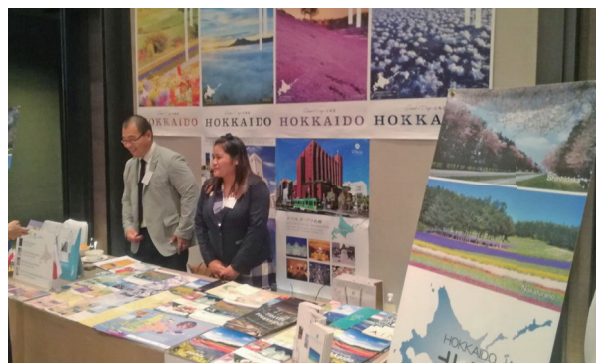
北海道観光のPRブース

2018年11月、北海道とともに主催した「北海道どさんこプラザ開設記念『食とワインのタベ in バンコク』」において、北海道の復興状況をタイの多くの関係者に発信したほか、食・観光の紹介も行っており、海外での各種イベントの中で道産食品や北海道観光のPRに積極的に取り組んでいます。